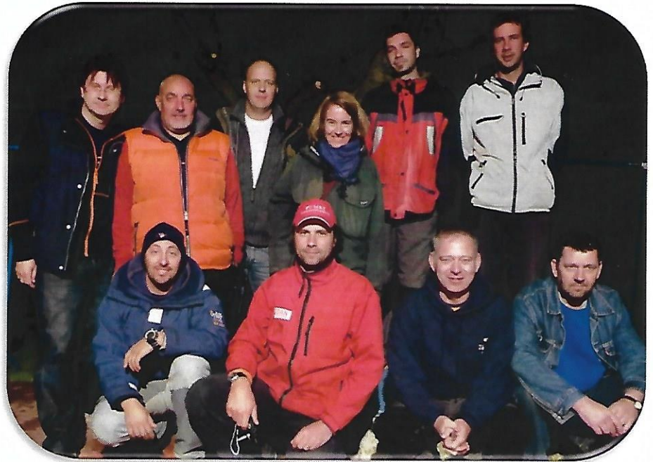
Abb. 4: Die kroatisch-bayerische Grabungsmannschaft.

Da die Vermessungsarbeiten an der Mole bereits am Freitagabend abgeschlossen waren, konnte ein Teil der bayerischen Teilnehmer am Samstag freinehmen und den restlichen Teil der archäologischen Hinterlassenschaften