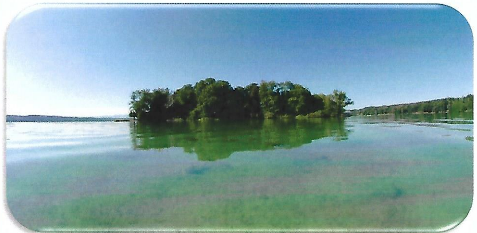
Abb. 1: Die Roseninsel im Starnberger See. Blick von Norden.

Bereits seit mehreren Jahrzehnten arbeiten Mitglieder der BGfU an verschiedenen unterwasserarchäologischen Projekten nahe der Roseninsel (s. Abb. 1). In den letzten Jahren standen hier die Dokumentation eisenzeitlicher Baubefunde an der Nordostspitze der Insel und Untersuchungen an der sog. „Oberen Brücke“ zwischen der Südspitze der Insel und dem Westufer des Sees im Vordergrund. Die genaue Funktion und der gesamte Verlauf dieser brückenartigen Anlage konnten jedoch noch nicht eindeutig bestimmt werden, besonders da ein Teilstück der Pfahlstellungen zwischen der Insel und dem Ufer zu fehlen scheint. Eine 2004 im Bereich der „Oberen Brücke“ mit einem Sedimentsonar durchgeführte Untersuchung führte zwar zu dem Ergebnis, dass der von der Uferseite aus verlaufende Kiesrücken künstlich angelegt worden war und nun in seinem genauen Verlauf dokumentiert werden konnte, lieferte aber keinen Hinweis darauf, dass in der Lücke zwischen dem Ende des Kiesrückens und der Insel weitere Pfahlstellungen existieren könnten. Auch das Ergebnis der C14-